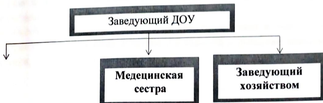
Схема. II направление — административное управление

Общее родительское собрание действует по плану, входящему в годовой план работы ДООУ. Общее родительское собрание собирается не реже 2 раз в год.